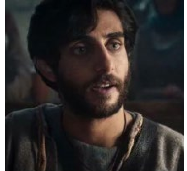
Judas Iscariotes: Luke Dimyan